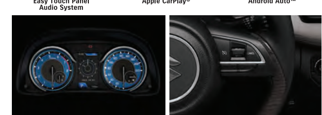
Stylish Meter Cluster