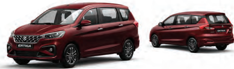
أحمر ميتاليك Auburn Red Pearl Metallic (ZY7)